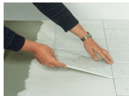
PCI Carraflex für die anwendungssichere Verlegung von Natursteinplatten und Marmor.